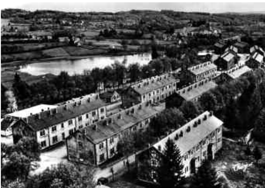
'Ilot' C (voorground) en D. Op de achtergrond Lac de Gratadour

In de eerste week van de oefenperiode lag