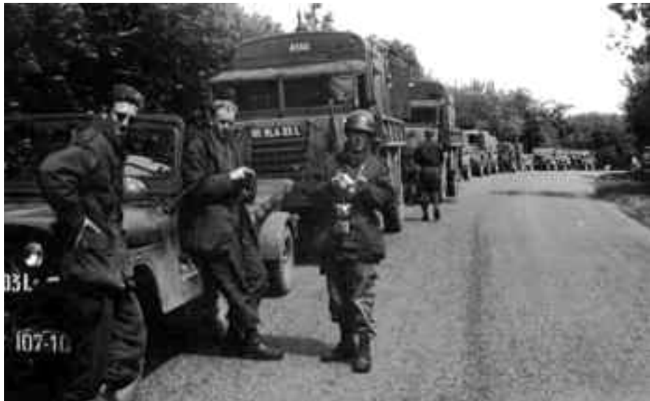
Het detachement van 107 Lusbdcie in 1959 op weg naar La Courtine

Kamp en oefenterrein La Courtine liggen op een granietplateau, bedekt door een dunne laag vette aarde, op 800 meter boven zee-niveau. Kenmerkend voor het 6200 ha grote oefenterrein (10 km lang, 6 km breed) zijn de hoge heuvels (de bekende 'Puy de ...') en diepe dalen. De begroeiing bestaat uit heide, varens, brem, berken- en moeilijk doordringbare naaldbossen. Het dun bevolkte gebied, doorsneden door talloze waterlopen, met moeras- en moddervlakten, maakt deel uit van het 'Plateau de Milleva-