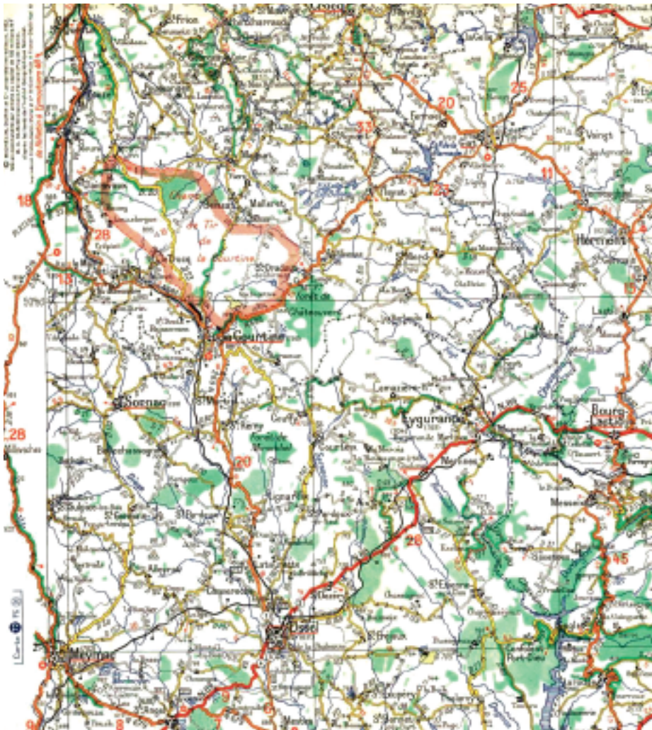
De ligging en omvang van het oefenterrein La Courtine

Het Ministerie continueerde de samenwerking met de Fransen tot en met 1964 omdat er zich vanaf 1965 weer oefenmogelijkheden in Duitsland aandienen. Dat kwam goed uit. Enerzijds omdat de terreinomstandigheden in het oefengebied absoluut niet overeenkwamen met die van het oorlogsgebied en anderzijds bleek het terrein minder geschikt te zijn om er met pantservoertuigen (AMX en YP-408) in te opereren. Bovendien vormde de grote afstand La Courtine - oorlogsgebied een bedreiging