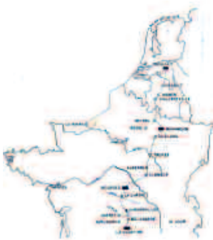
De heen- en terugtochtroute naar La Courtine

de nadruk op de training van de compagnieën, eskadrons en batterijen met aparte schietoefeningen voor tanks en artillerie. Daarna volgde een aantal, meestal tweedaagse, bataljonsoefeningen. De oefenperiode werd afgesloten met een drie- of vierdaagse oefening voor de gehele gevechtsgroep (vanaf 1962 ook (pa)infanteriebrigade) onder leiding van (delen van) de divisie- en/of legerkorpsstaf.