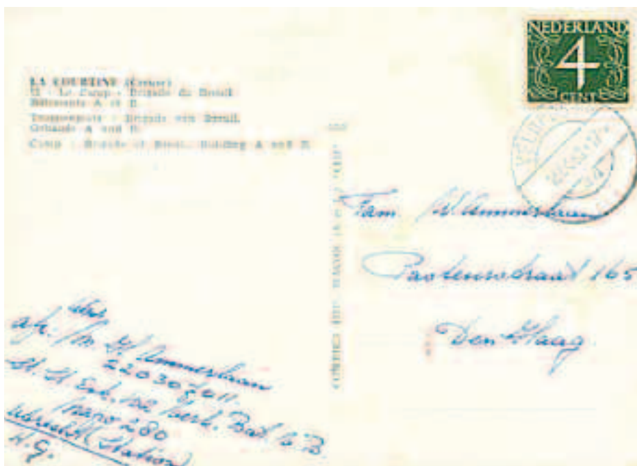
Een prentbriefkaart met veldpostgegevens uit La Courtine