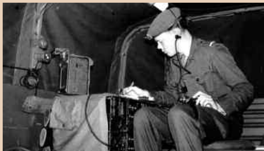
Een luchtsteunverbinding AN/VRC-506 in een DAF YA-126