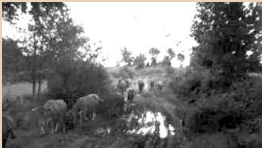
Vijandelijke tanks in het voorterrein...