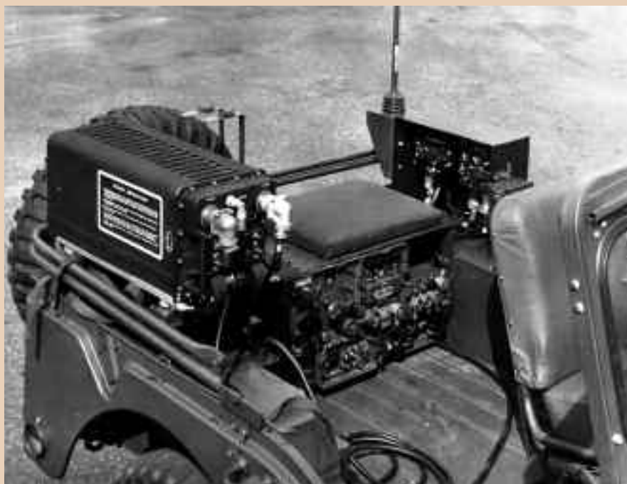
Radioinstallatie AN/VRC-30 in jeep M38A1 (Nekaf)