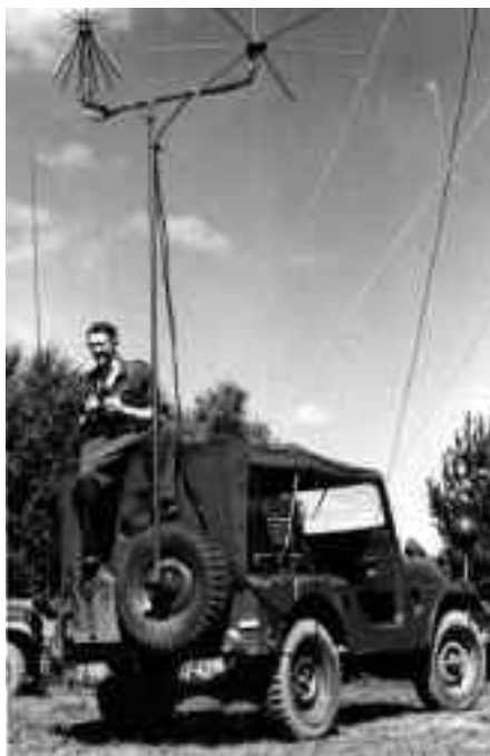
Een jeep in 1959 voor het Air Control team met AN/VRC-30 en UHF- en VHF-antennes

Bij de vele grote oefeningen in de jaren vijftig in Duitsland was er grote behoefte aan veldpostdetachementen. Om die te kunnen samenstellen werd mobilisabel veldpostpersoneel voor herhalingsoefeningen opgeroepen. Door de vele oefeningen voldeed deze regeling echter niet meer. Daarom besloot de legerleiding per 17 maart 1957 een deel van 901 Veldpostdetachement in Utrecht paraat te stellen en te laten fungeren als hoofdveldpostkantoor. Het nieuwe detachement betrok een gebouwtje op de Van Sijpesteijnkazerne in Utrecht. Van hieruit werd de eerste jaren voornamelijk de post voor oefenende eenheden in het buitenland verzorgd. Na de stationering van personeel van de krijgsmacht in het buitenland werd de verzorging van het postverkeer hiervoor steeds belangrijker.