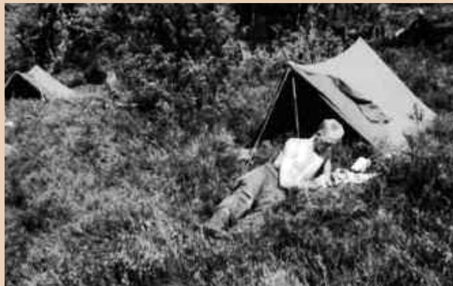
Rustdag te veld