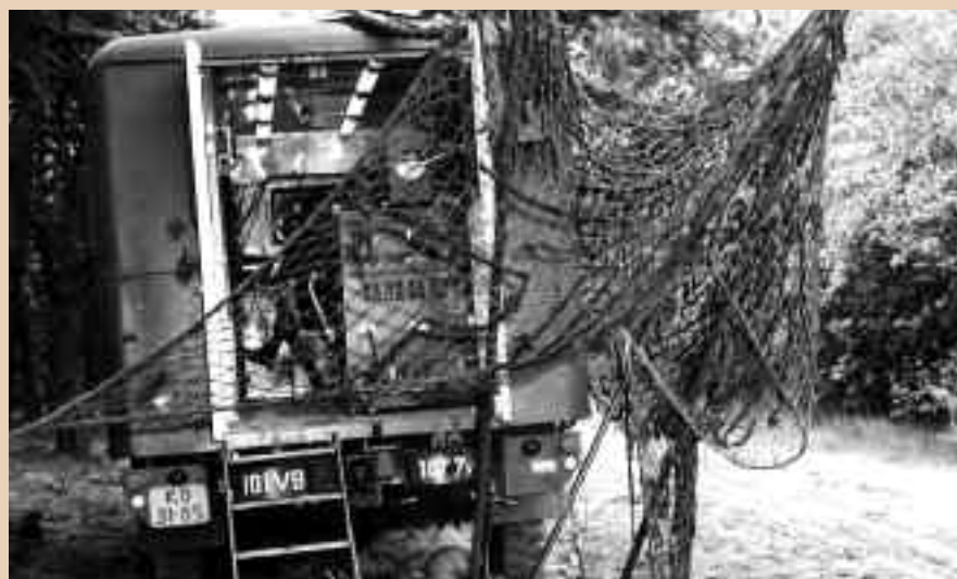
Een 'ASSU'-voertuig in opstelling