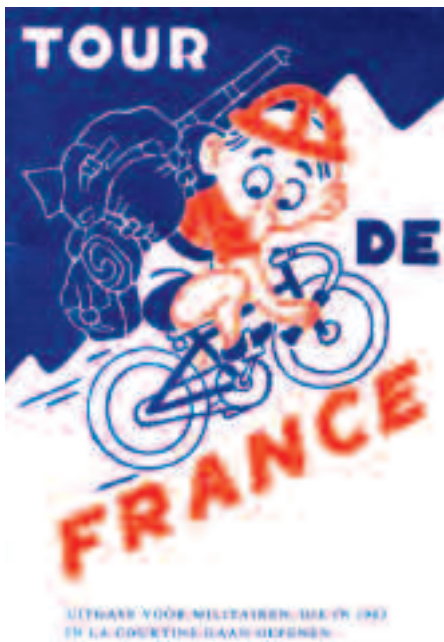
Voorkant van het boekje 'Tour de France'

voor de feitelijke paraatheid van de KL. Dat laatste werd pijnlijk duidelijk toen in 1961 ± 150 man van 41 Vbdat ijlings uit La Courtine terug moesten keren naar Harderwijk wegens de spanningen met de Sovjet Unie.