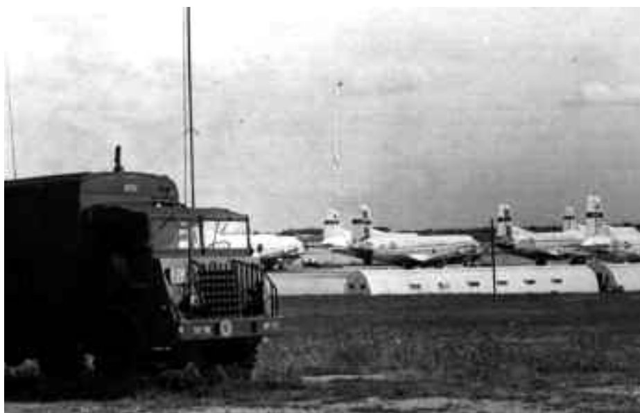
Opstelling SCR-399 voertuig (GLO-net) bij vliegveld Chateauroux

Het Ministerie kwam met de Fransen overeen dat de Nederlandse strijdkrachten voor eigen behoeften een militaire postdienst konden exploiteren. Met Nederlandse voermiddelen mochten gesloten postzendingen tussen La Courtine en een postkantoor in Nederland en in omgekeerde richting